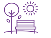
حديقة عامة Community Park