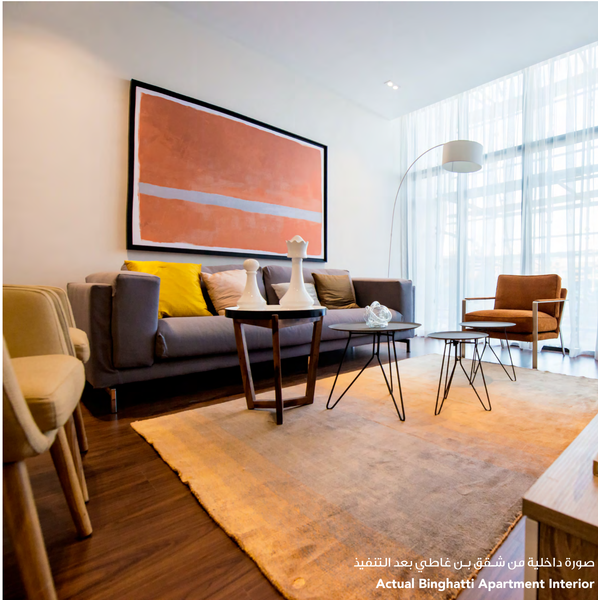
صورة داخلية من شقق بن غاطي بعد التنفيذ Actual Bingham Apartment Interior

توفر الشقق المتنوعة بالمشروع مساحات معيشية مريحة لكل مقيم، لكل شقة تصميمها الفريد مع مراعاة توفير السكنية والهدوء. تم تخطيط التجهيزات الداخلية بعناية فائقة لتوفير أكبر قدر من الراحة والأناقة على حدٍ سواء.