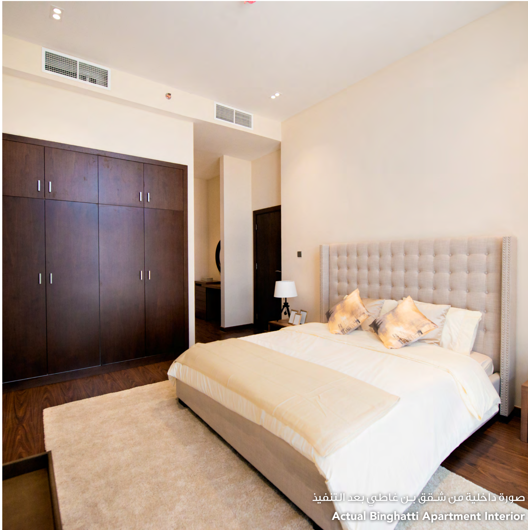
صورة داخلية من شقق بن غاطي بعد التنفيذ Actual Binghatti Apartment Interior