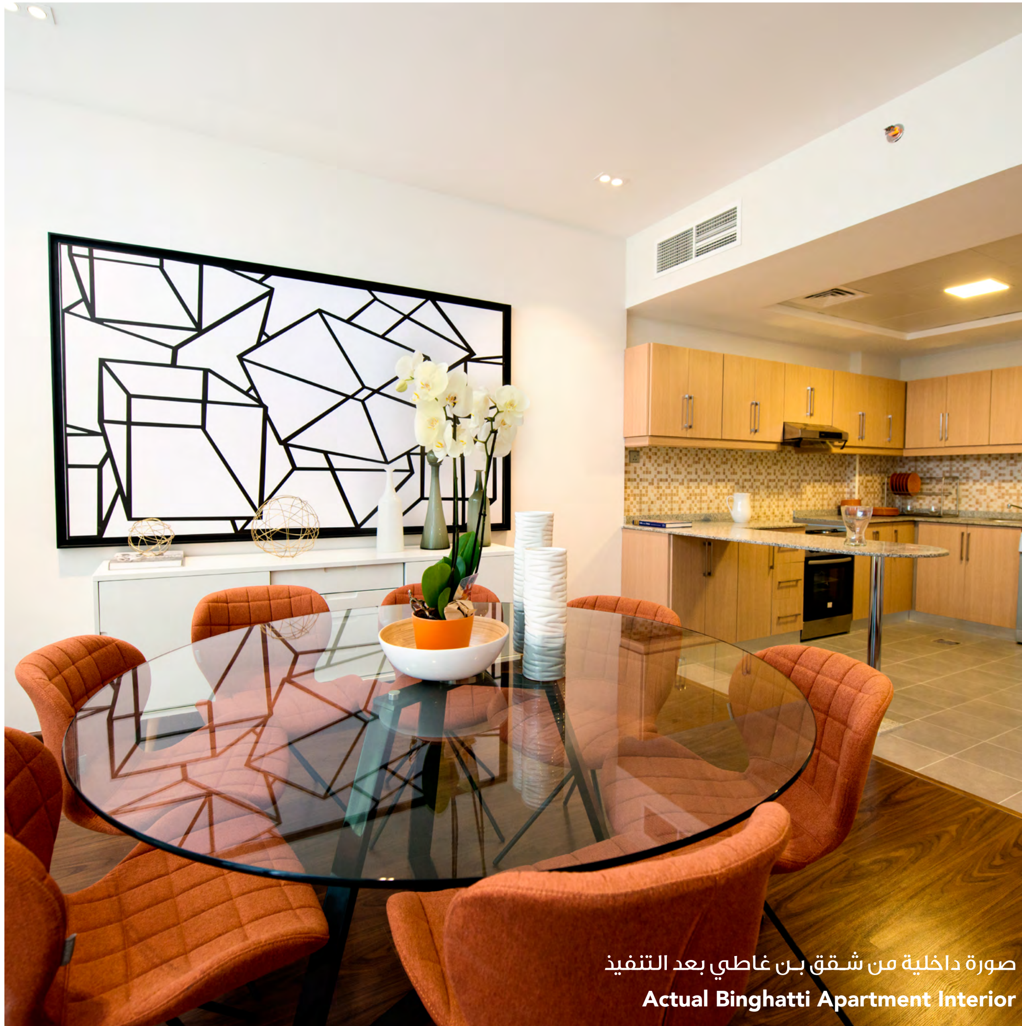
صورة داخلية من شقق بن غاطي بعد التنفيذ Actual Bingham Apartment Interior

تعتبر شقق الغرفة الواحدة الشاسعة بيئة شاعرية للأفراد المتميزين والمحظوظين حيث صممت بدقة وحرفية تمنح تصميمًا رائعًا وفعال لتوفير أكبر قدر من الاستخدام والراحة المكانية.