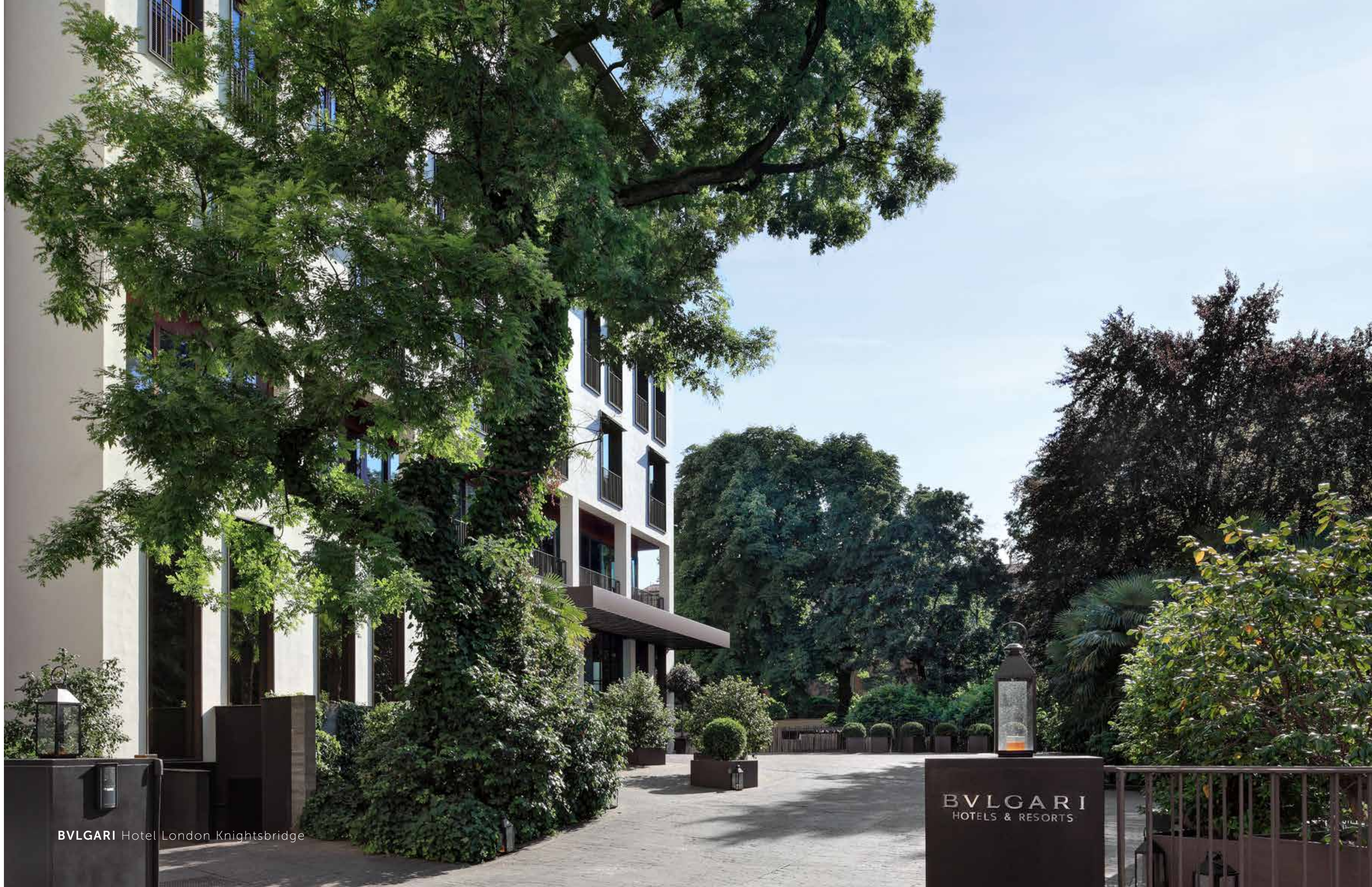
BVLGARI Hotel London Knightsbridge

كما توفر تلك الفنادق والمنتجعات تجربة فريدة لنزلائها من خلال مفهوم خدمات الرفاهية المبتكرة، ناهيك عن المطعم الإيطالي والمطاعم الأخرى التي تقدم وجبات محلية والتي تجعل منها مكاناً مثالياً لالتقاء نخبة الفئات الاجتماعية المحلية.